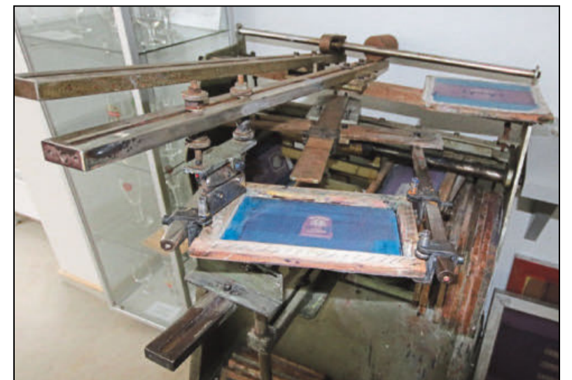
Mit Hilfe der Siebdruckmaschine wurden auch Bedruckungen für runde Biergläser hergestellt.