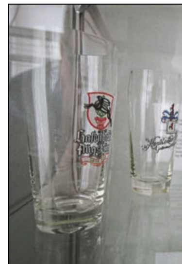
Mundgeblasene Biergläser aus dem Jahr 1970.